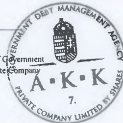
Exhibit Index on Page 3